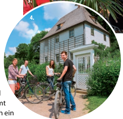
1. Bäckerei „Backstube“ in Erfurt. 2. Anna Amalia Bibliothek in Weimar. 3. Wagnergasse, die Kneipenmeile in Jena. 4. Goethes Gartenhaus in Weimar.

> oder Radieschen schmeckende Brunnenkresse: „Die Haupternte findet im September, Oktober, März und April statt. Pro Quadratmeter kann man zwei bis vier Kilo ernten.“ Die saftig grünen Wasserfelder des weltweit bedeutendsten Anbaugebiets für Brunnenkresse befinden sich in Becken, Klingen genannt. In ihnen gedeiht die Kresse im zehn Zentimeter hohen, elf Grad kalten, langsam fließenden Wasser. Geerntet wird sie mit den Händen, teils auf Bohlen und schmalen Holzstegen kniend oder liegend. Brunnenkresse enthält viel Vitamin A, B und C, sogar die Vitamine D und E kommen in ihr vor.