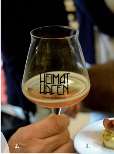
1. Suppe aus fruchtigen Tomaten und Kokosmilch im „Cognito“. 2. Bier „Gabi“ im Thüringer Spezialitätenmarkt der Brauerei „Heimathafen“. 3. Thüringer Rostbratwurst auf Kloßscheibe mit Kraut im „Pier 37“.